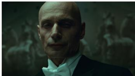
Next Floor de Denis Villeneuve (2008)

Ce court métrage d'animation sur la vie du cinéaste Ryan Larkin a remporté l'Oscar du meilleur film d'animation.