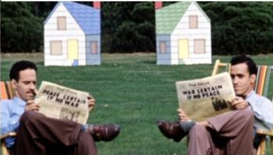
Voisins de Norman McLaren (1952)

Norman McLaren a inventé dans ce court métrage sur la guerre le procédé de pixellisation. Cette innovation lui a valu l'Oscar du meilleur court métrage.