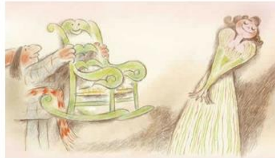
Crac! de Frédéric Back (1981)

Norman McLaren a inventé dans ce court métrage sur la guerre le procédé de pixellisation. Cette innovation lui a valu l'Oscar du meilleur court métrage.