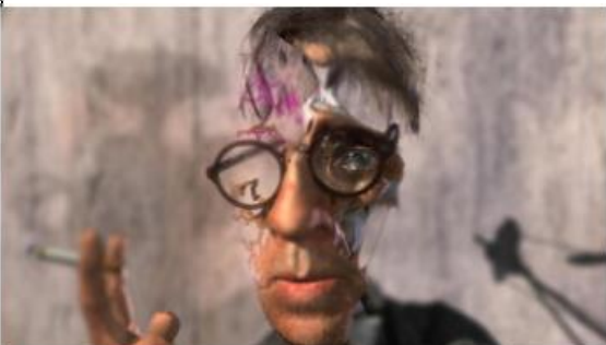
Ryan de Chris Landreth (2004)

Ce court métrage sur la vie d'une chaise berçante a remporté l'Oscar du meilleur court métrage d'animation et a inspiré les créateurs de Pixar.