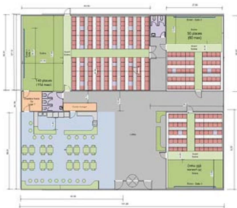
Plan préliminaire, complexe multisalles et espace bistro, phase II

Le cinéma Station Vu sera un lieu culturel novateur ancré dans sa communauté. Il s'inscrit dans une perspective de développement durable qui allie les objectifs économiques, sociaux et environnementaux à la culture. Afin de réaliser la construction de cette salle unique au Québec, il sera nécessaire d'amasser une somme de 2,5 M$ pour la mise sur pied de la phase II. Cette somme sera répartie en travaux de construction, en acquisition de terrain et d'équipements spécialisés. Pour ce faire, Station Vu compte sur la participation financière des divers paliers de gouvernements, des fonds privés et institutionnels.